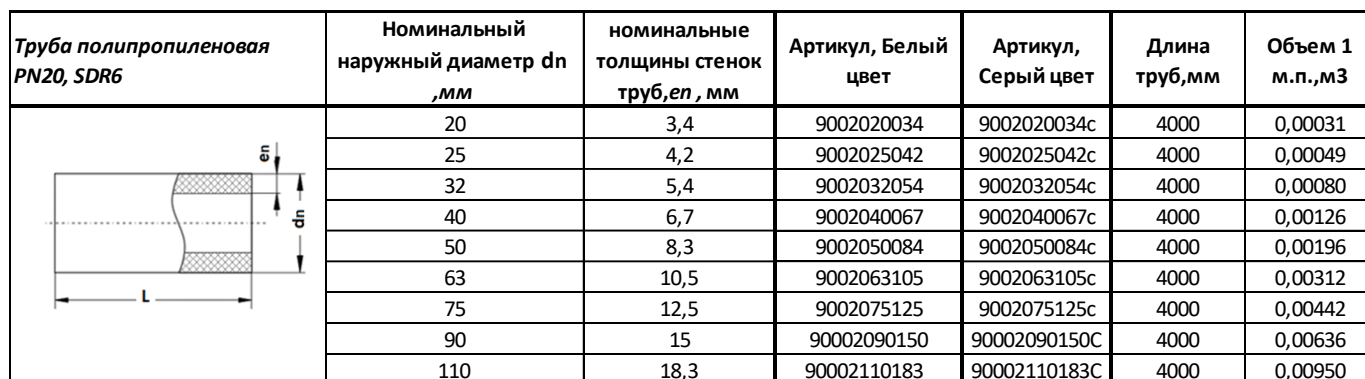
Таблица 5 – Сортамент труб напорных из полипропилена SDR 6 ( PN20 ).

3.5 Сортамент выпускаемой продукции указан в таблице 5.